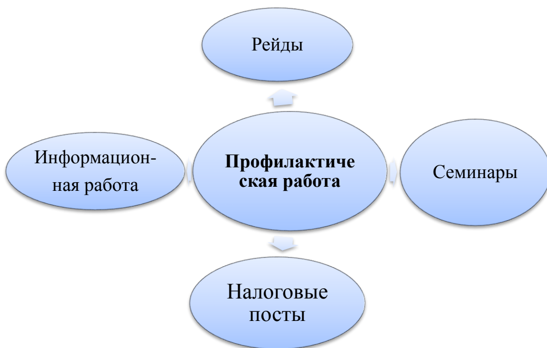
Рис.3. Суть профилактической работы

Система камеральных проверок в настоящее время является не эффективной и необходимо проведение ряда мероприятий по ее совершенствованию [5, с.102–104]: