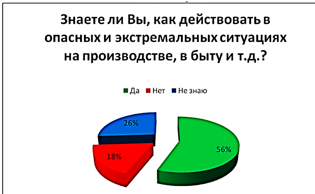
Рис. 2. Опрос 2

После проведения опроса нами были проведены небольшие пятиминутки: Имитационная игра – Предвидение опасностей в элементарных ситуациях («Я часто возвращаюсь домой в позднее время», «Как перейти реку вброд»).