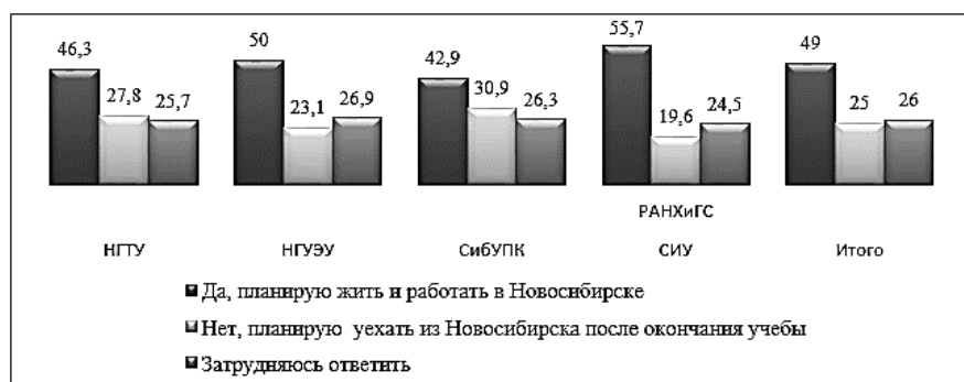
Рис. 2. Планы на будущее (в % к числу опрошенных)

настроены на конструктивное сотрудничество с администрацией вузов и органами местного самоуправления. Показателем общей удовлетворенности молодых людей возможностями самореализации является желание связать свою дальнейшую жизнь с регионом проживания. В этой связи мы задали респондентам вопрос, хотят ли они в будущем связать свою жизнь с Новосибирском? (см. рис. 2).