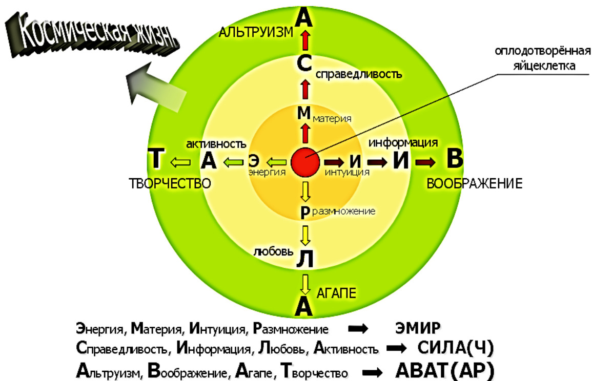
Рис. 2. Три этапа формирования и развития современного человека ступенями ЭМИРа, СИЛАча и АВАТара

Теперь стали побеждать во внутри видовой борьбе те племена, которые эффективнее использовали уже культурные наработки. И, поскольку биологическая эволюция и отбор продолжали ещё в той или иной степени «работать», эти новые и необычные для животного мира черты или свойства психики и поведения начали «запоминаться» и передаваться из поколения в поколение генетически. Так у наших предков сформировались целый ряд уже культурных , человеческих инстинктов, в числе которых были ксенофобия, любознательность, способность к вербальным и чувственным абстрагированию и конкретизированию и др. Именно наличием этих человеческих (культурных) инстинктов человеческий эмир отличается от ЭМИР ов животных. Поэтому самой первой задачей, которую приходится решать каждому новому человеку на пути к очеловечиванию, является подавление в себе одних культурных инстинктов и акцентуация других. Например, в наши дни человеку следует подавить в себе ксенофобию и усилить