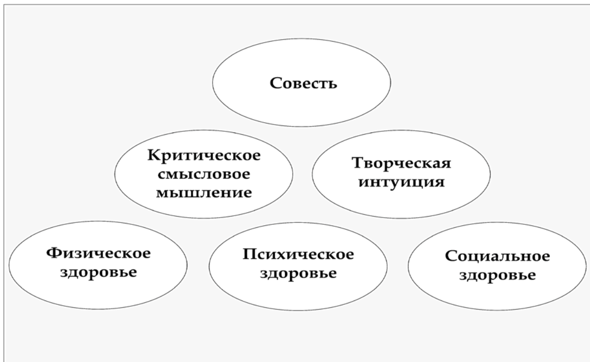
Рис. 1. Компоненты человеческого капитала

состояние пяти психических процессов – памяти, внимания, мышления, восприятия и воображения, – на 95% гарантирует хорошее же психическое здоровье человека. Однако, в последние годы пришлось к этим пяти психическим процессам прибавить ещё четыре: вербальные абстрагирование и конкретизирование и чувственные абстрагирование и конкретизирование.