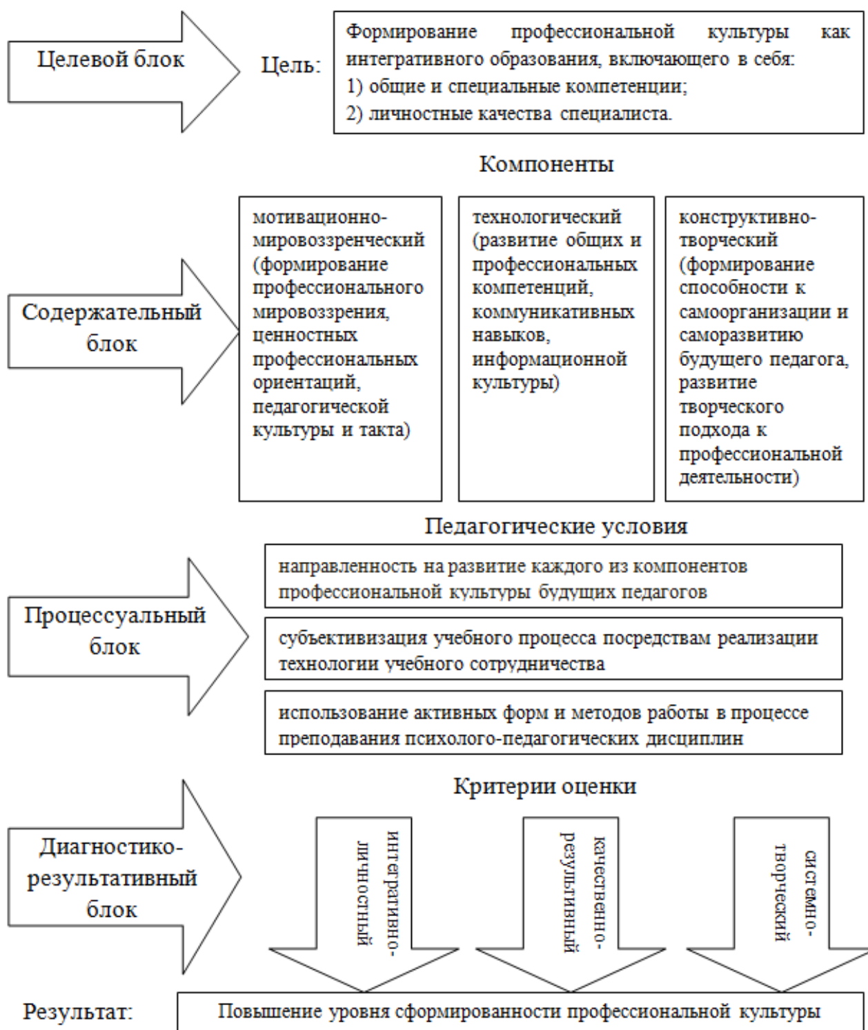
Рис. 2. Модель формирования профессиональной культуры студентов

Таким образом, рассмотрение различных подходов к определению понятия профессиональной культуры, позволило выделить наиболее приемлемый для данного исследования - интегративный подход, сторонники которого рассмат-