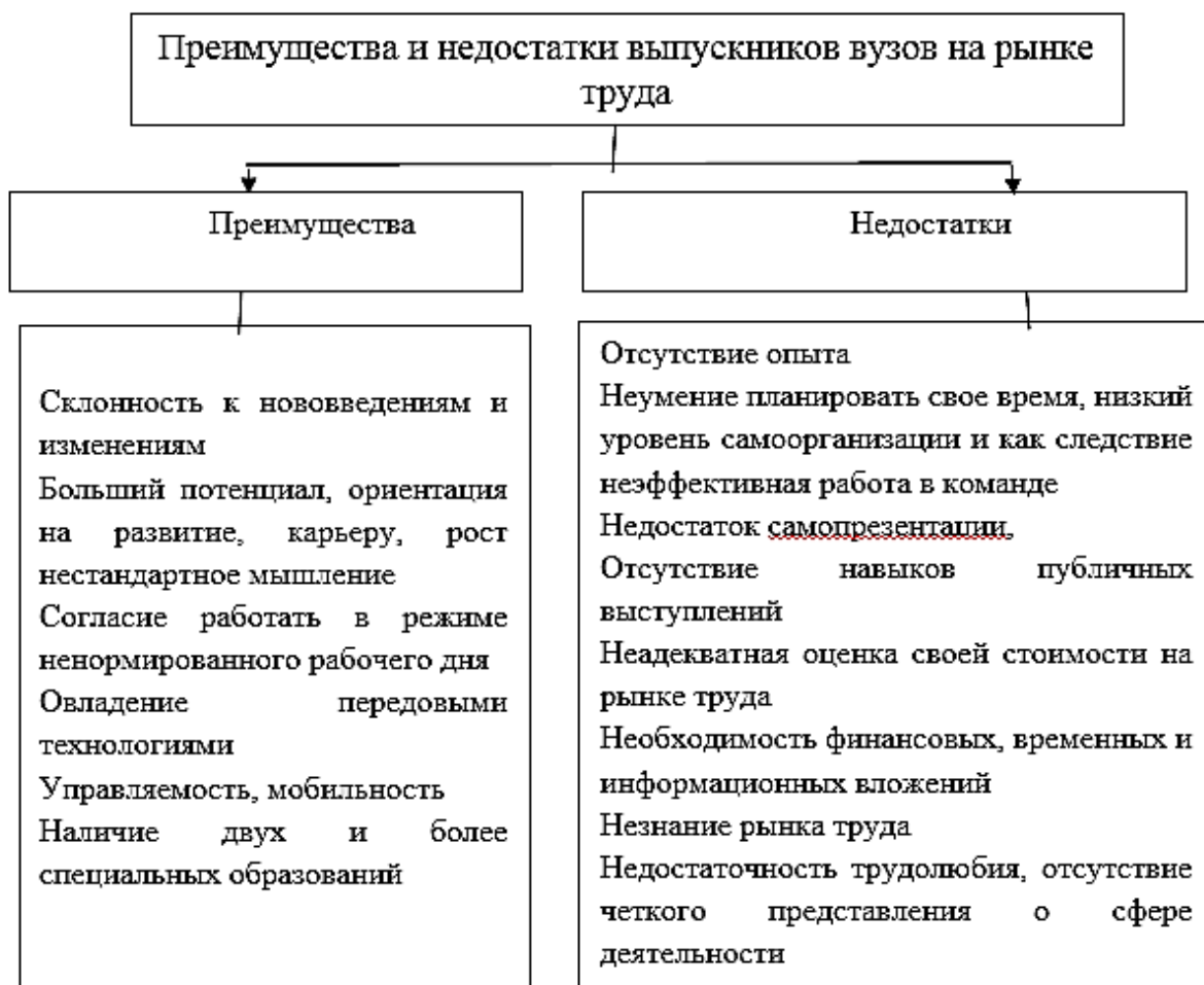
Рис. 1. Авторский подход к определению преимуществ и недостатков выпускников вузов на рынке труда

Авторский взгляд на основные преимущества и недостатки выпускников вузов на рынке труда показаны на рис. 1.