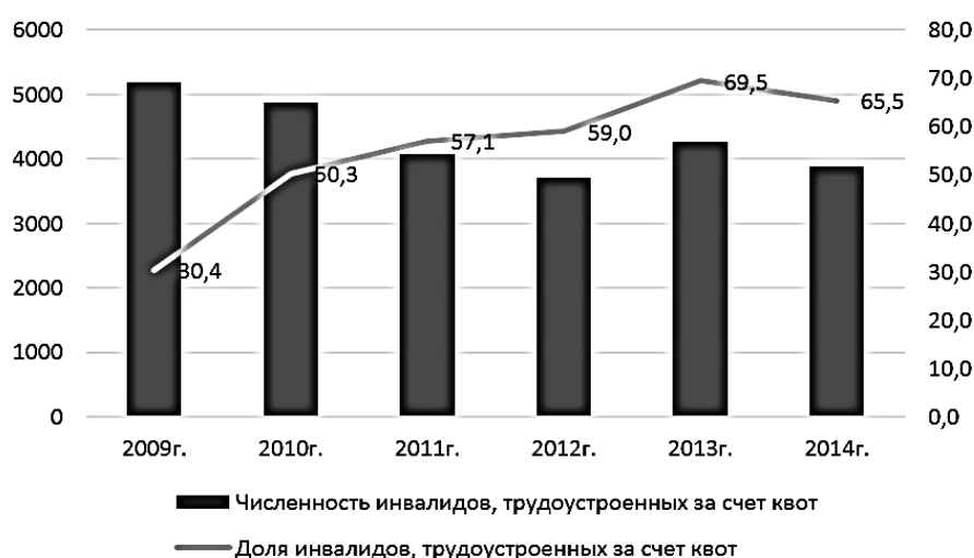
Рис. 3. Динамика численности и доли инвалидов, трудоустроенных за счет квот

Анализ доли инвалидов, трудоустроенных за счет квот за последние годы имеет динамику роста (рис. 3).