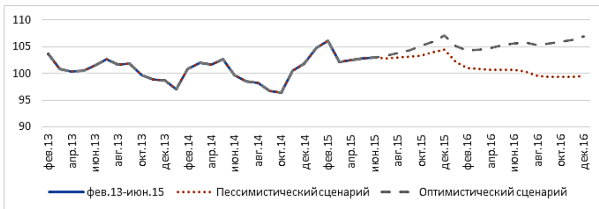
Рис. 1. Сценарии динамики развития деловой активности Республики Татарстан

В общем виде прогноз динамики индекса деловой активности в Республике Татарстан на 2015–2016 гг. представлен на рисунке 1.