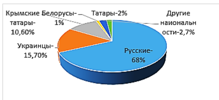
Рис. 1. Национальные группы Республики Крым, %

Республика Крым – уникальная территория, площадью всего около 26 тыс. кв. км – в 14 раз меньше Камчатки. Но в Крыму проживают представители 175 национальностей. К 29 национальностям относятся 99% жителей Крыма.