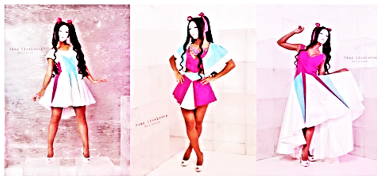
Рис.3. Разработка коллекции женской одежды на основе графического произведения Олафа Хайека «Мелодия» (студент Я. Левашова)

Данный метод ассоциативных связей помогает студенту посмотреть на источник с разных точек зрения и предложить новое, подчас очень неожиданное, прочтение известной темы.