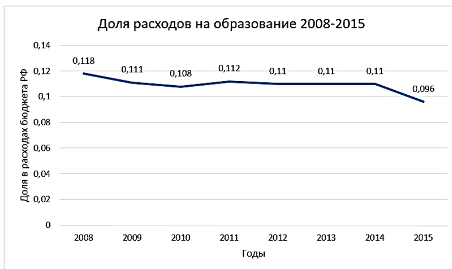
Рис. 1. Доля расходов на образование в расходах консолидированного бюджета РФ 2008–2015

Данные о долях в расходах консолидированного бюджета страны включают текущие и капитальные расходы уровней власти: центрального, регионального и местного, а также как прямые госрасходы на учебные заведения, так и субсидии населению. Превалирующей частью расхода на образование за рассматриваемый период является расход на высшее и послевузовское профессиональное образование. Общей тенденцией в политике образования в РФ, как и в исследованном периоде, является снижение расходов, так, например, сейчас проходит массовое объединение учебных заведений всех уровней (с целью снизить расходы на их административный аппарат). Наше личное мнение таково, что такая политика приведет к снижению качества образования, утери признанных с советских времен высоких стандартов образования.