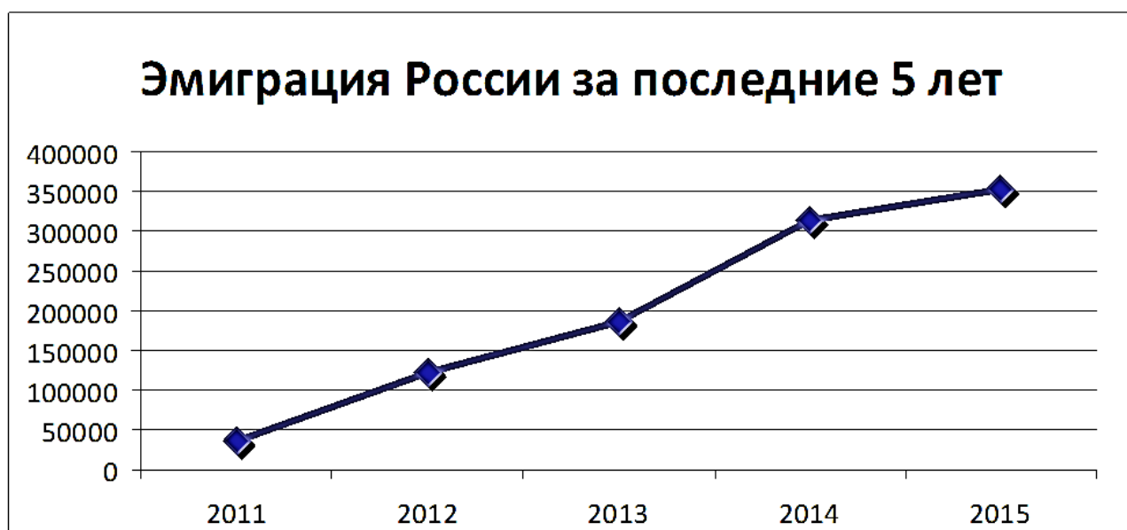
Рис. 1. Эмиграция России за последние 5 лет [1]

По данным графика (рис. 1) мы можем наблюдать резкое повышение потока эмигрантов за последние 5 лет, При этом, на чемоданах сидят самые образованные и высококвалифицированные специалисты.