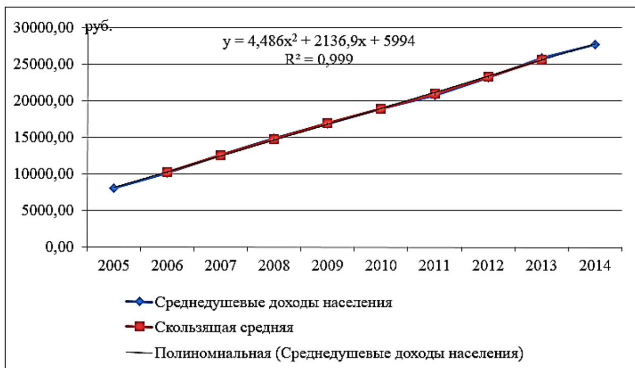
Рис. 1. Линия тренда среднедушевых доходов

Одним из важнейших показателей уровня жизни является среднедушевой доход населения. В данном случае был проведен анализ среднедушевых доходов населения с 2005 по 2014 год. На рисунке 1 – результаты аналитического выравнивания данного показателя по данным, представленным Росстатом [4].