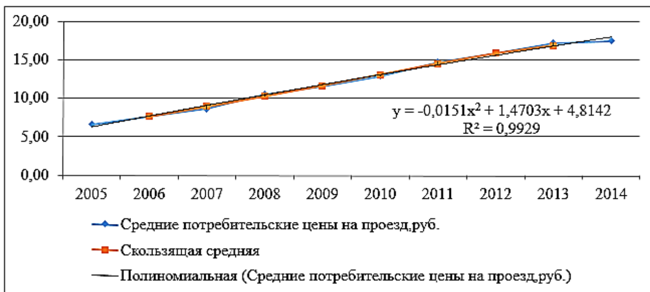
Рис. 2. График тренда цен на проезд в городском транспорте в период с 2005 по 2014 год

Для определения основной тенденции цен на проезд в городском транспорте в период с 2005 по 2014 год было осуществлено аналитическое выравнивание. Результаты выравнивания наглядно представлены на рисунке 2.