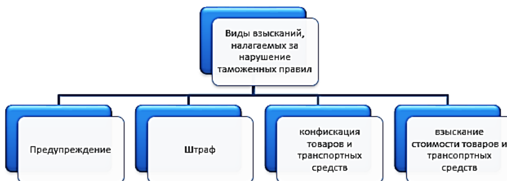
Рис. 3. Виды взысканий, налагаемых за нарушение таможенных правил

Оперативно-розыскная деятельность и дознание осуществляется соответствующими подразделениями таможенных органов по борьбе с преступлениями в сфере таможенного дела. Обязанность организации координации выполнения таможенными органами в пределах их компетенции функций органов дознания по уголовным делам возлагается на органы дознания ФТС. Пронаблюдать за мерами предотвращения и наказания за совершение таможенных преступлений, мы можем на рисунке [3].