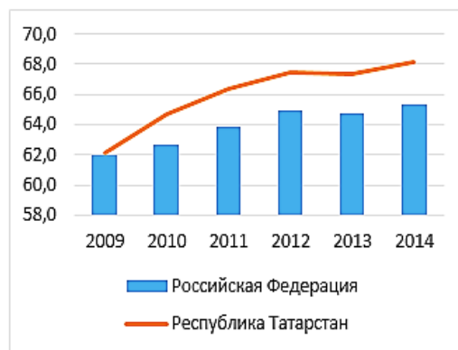
б) Уровень занятости, в % к численности населения в возрасте 15–72 лет