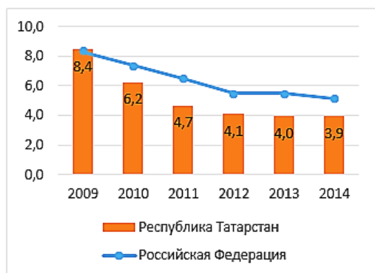
а) Уровень безработицы, в % к численности экономически активного населения

Вопреки негативным тенденциям замедления экономики рынок труда в Республике Татарстан оставался устойчивым, при этом уровень безработицы вновь оставался на очень низком уровне продемонстрировав рекордное в новейшей истории значение (3,9% от численности экономически активного населения).