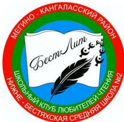
Рис. 1. Эмблема клуба «БестЛит»

Клуб любителей чтения «БестЛит» имеет свою эмблему, в котором изображены круги (единство деятельности ученика, учителя и родителей), книга олицетворяет само направление клуба, перо указывает на творческую деятельность членов клуба, а птицы олицетворяют развитие, полет фантазии школьников (рис 1.).