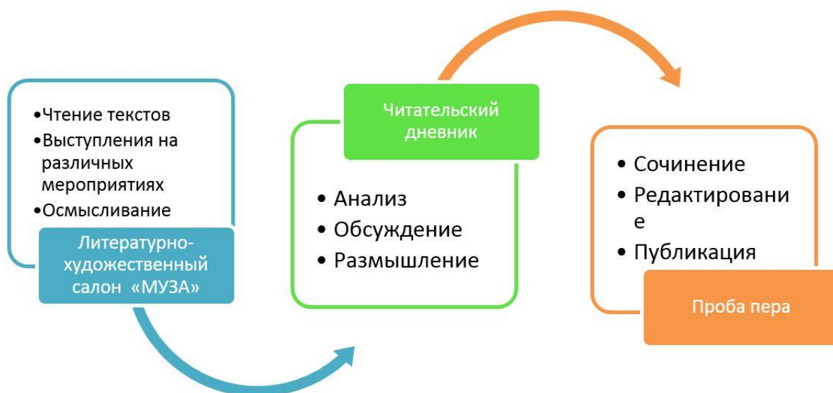
Рис. 2. Направления работы клуба «БестЛит»

«БестЛит» имеет 3 направления, которые строго последовательны (рис. 2).