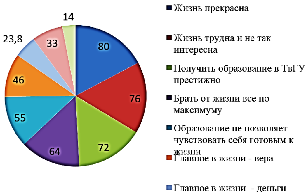
Рис. 2. Жизненные принципы студентов (%)

На вопрос «Какие качества вы хотите развивать, обучаясь в вузе?» 40% респондентов отметили ораторские способности, 30% – интеллектуальные, каждый пятый из опрошенных желал развить лидерские качества, 10% – уверенность в себе и только 5% опрошенных отметили такое важное качество как ответственность. Интересно, что лишь в единичных случаях указывался профессионализм, что может с одной стороны свидетельствовать о недостаточной развитости профессиональной направленности личности, с другой являться следствием неустойчивости рынка труда. Вместе с тем стремление работать над собой вступает в противоречие с доминирующим качеством современного студента – ленью, которую выделили подавляющее число участников анкетирования (90%).