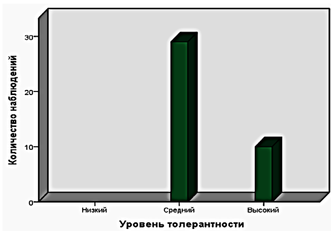
Рис. 3. Общий индекс толерантности

Средний показатель общего индекса толерантности студентов магистратуры ТвГУ составил 92,2, что соответствует верхнему интервалу среднего уровня (61–99 баллов) (см. рис.3).