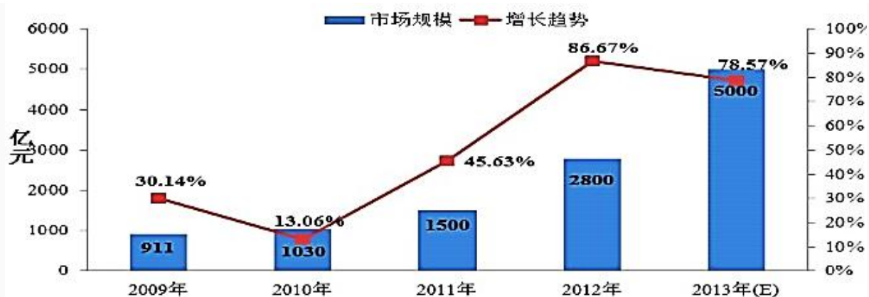
Рис. 1. Объем продаж за 2009–2013 гг. продуктов здорового питания в Китае в целом, млрд юаней, в %