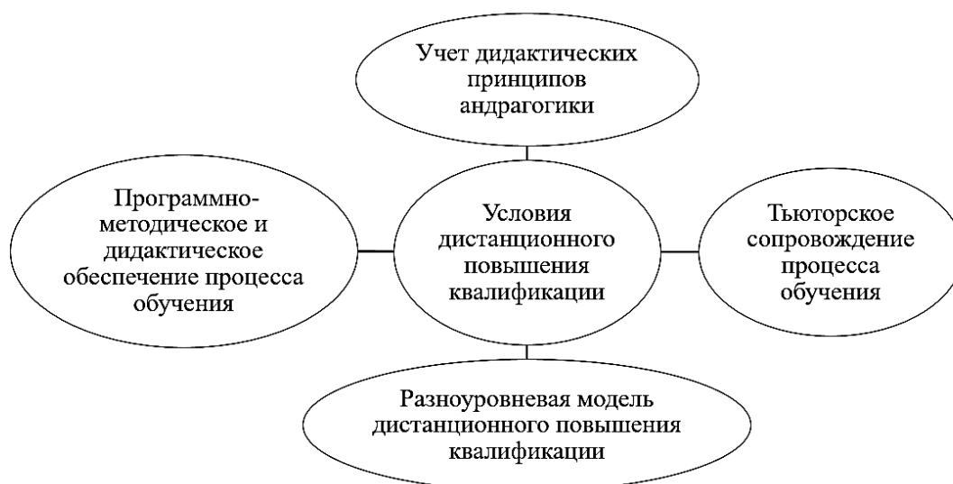
Рис. 2. Условия дистанционного повышения квалификации

Опираясь на особенности и принципы дистанционного обучения и вышеперечисленные особенности дистанционное повышение квалификации, как формы обучения, можно выделить ряд возможностей дистанционного повышения квалификации, представленных в рисунке 3.