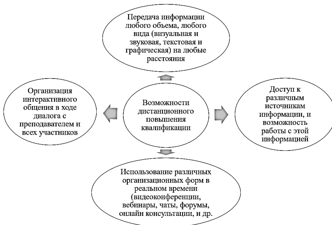
Рис. 3. Возможности дистанционного повышения квалификации

Опираясь на особенности и принципы дистанционного обучения и вышеперечисленные особенности дистанционное повышение квалификации, как формы обучения, можно выделить ряд возможностей дистанционного повышения квалификации, представленных в рисунке 3.