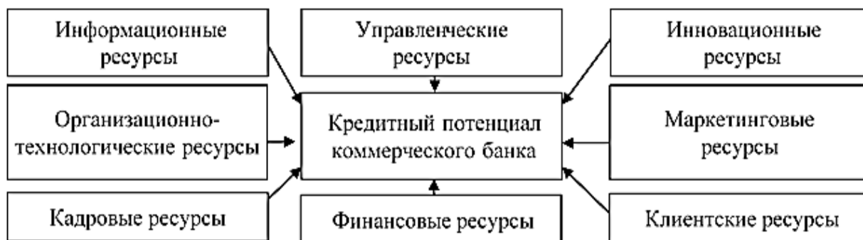
Рис. 1. Источники, обеспечивающие структуру банковского кредитного потенциала

Ресурсы, выступающие в качестве источников кредитного потенциала, должны предоставлять возможность дать характеристику кредитной деятельности банка, целям образования и применения кредитного потенциала, взаимосвязи между элементами и группами ресурсов, а также определить кредитный потенциал в качестве основы кредитной деятельности, как динамическую и трансформационную категории.