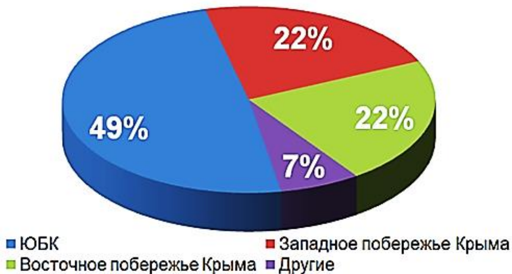
Рис. 1. Распределение турпотока по регионам Республики Крым

Основываясь на данных анализа турпотока за 2015 год, можно выделить главное – неравномерность распределения рекреантов по регионам Республики. При этом максимальная концентрация природных ресурсов находится в Евпаторийском, Керченском и Сакском районах.