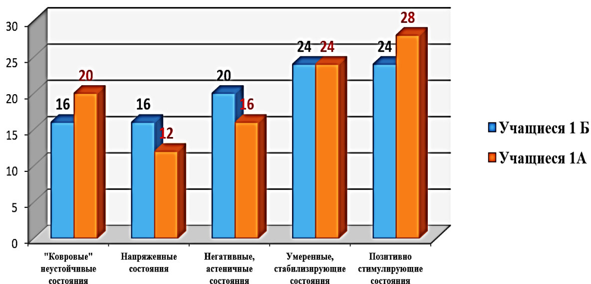
Рис. 1. Показатели эмоциональных состояний первоклассников

Выборку исследования составили 50 респондента – первоклассники в возрасте 7–7,5 лет (25 учеников 1 «А» класса, 25 учеников 1 «Б» класса). База исследования – Муниципальное бюджетное общеобразовательное учреждение «Лицей №7» Кстовского муниципального района Нижегородской области г. Кстово. Первоначально нами была проведена диагностика по методике эмоционально-цветовой аналогии (цветописи) (А.Н. Лутошкина). Детям, участвовавшим в эксперименте, предлагалось в течение недели заполнять дневник настроения в соответствии с инструкцией.