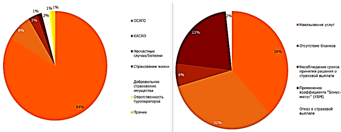
Рис. 2. Сравнение распределений обращений по видам страхования и в разрезе ОСАГО за II квартал 2015 г. [4]

И одну, из выше перечисленных проблем, мы можем подтвердить статистикой (рис. 2).