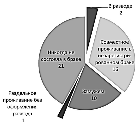
Рис. 1. Семейное положение

21), двое – разведены, одна респондентка проживает отдельно от мужа без оформления развода. На рисунке 1 представлено семейное положение исследуемой выборки.