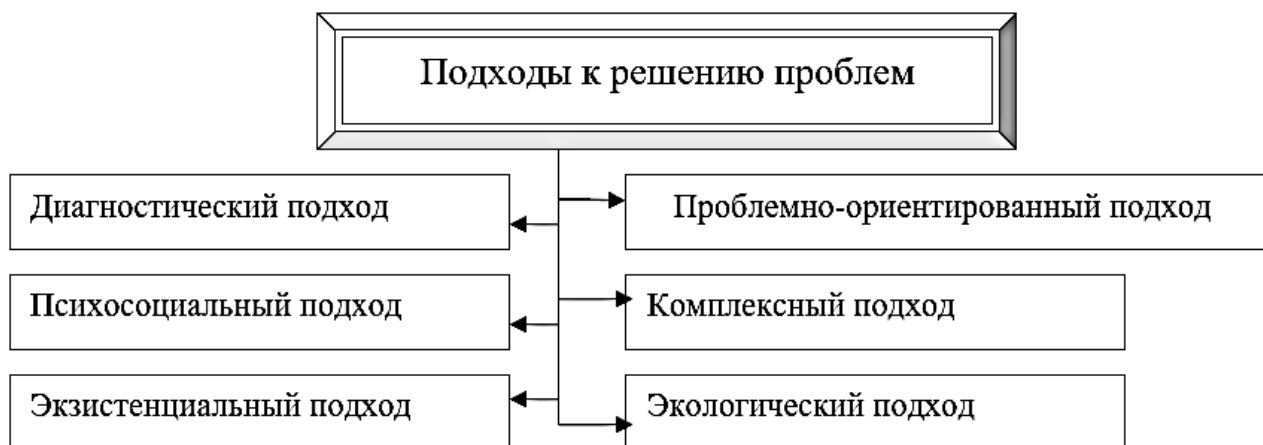
Рис. 3. Основные подходы к решению проблем клиента

Практика решения проблем клиента, полагает Н.П. Щукина, связана с привлечением следующих научных подходов (рис. 3) [4].