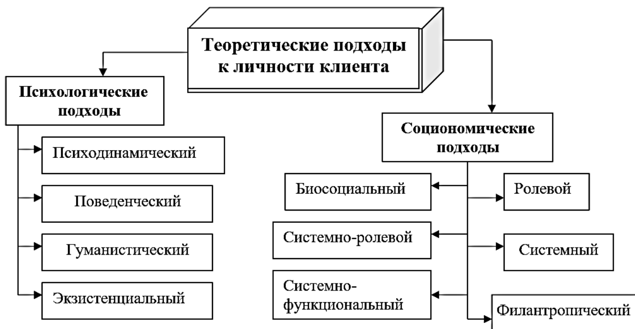
Рис. 2. Теоретические подходы к личности клиента

Рассматривая основные подходы к решению проблем в социальной работе, А.А. Козлов предлагает выделить два основных подхода к клиентам и их проблемным ситуациям: технический подход; коммуникативный подход [2]. Автор пишет, что при техническом подходе социального работника можно сравнить с врачом или инженером, осуществляющим корректирующие интервенции в жизненные ситуации клиента. При техническом подходе взаимодействие с клиентом носит иерархический и ассиметричный характер. Специалист в отношениях с клиентом пользуется властью профессиональной компетентности (выбирает и применяет техники интервенции). Для клиента важно — следовать компетентным рекомендациям специалиста.