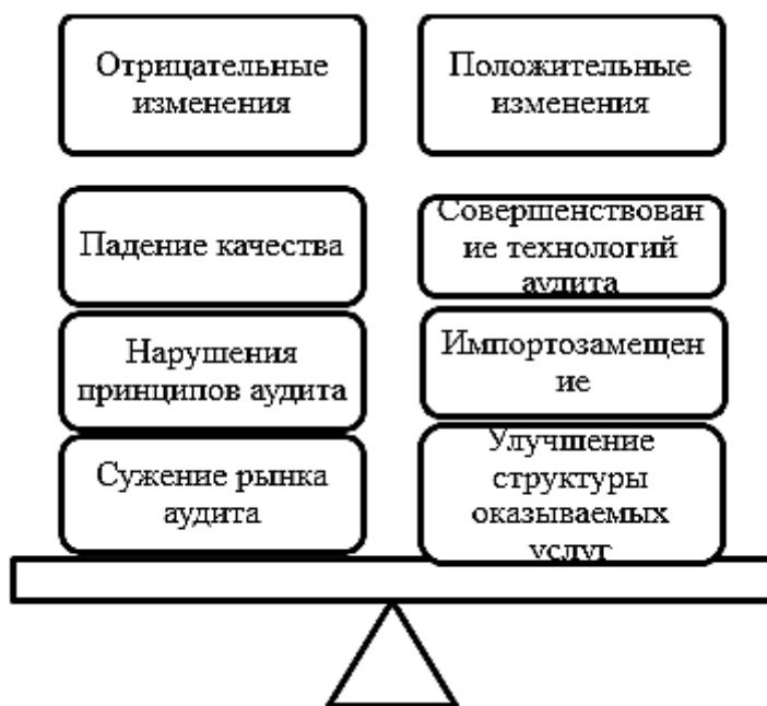
Рис. 3 Последствия экономического кризиса для рынка аудита

В 2014–2015 гг. ситуация экономического кризиса привела к сжатию рынка аудита и вызвала разнонаправленные изменения (рис.3).