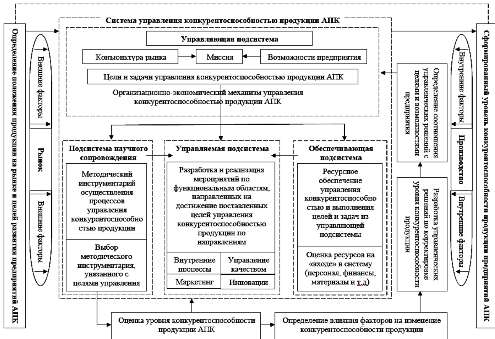
Рис. 2. Механизм управления конкурентоспособностью продукции АПК