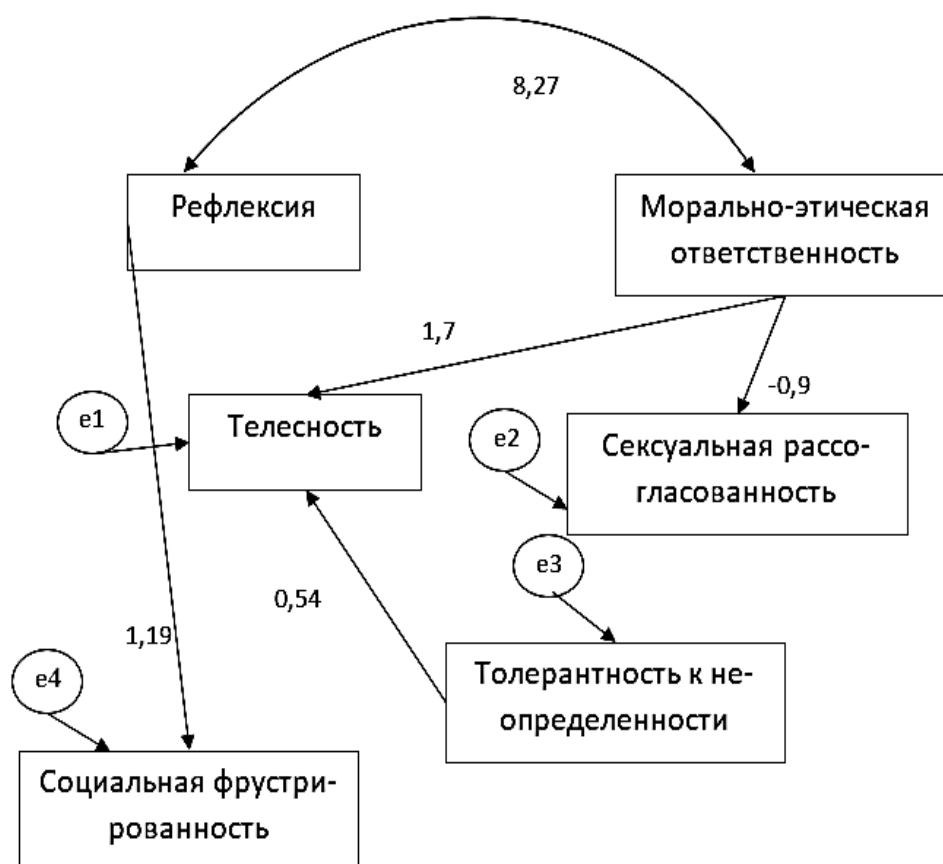
Рис. 3. Анализ путей созданной Модели 3 с регрессионными нагрузками

Полученные результаты путевого анализа для Модели 3 показали очень хорошее соответствие модели. Как видно из таблицы 3 критерий CMIN/DF < 2 , коэффициенты GFI, NNFI, IFI и CFI близки к 1. А наиболее робастный критерий RMSEA (0,04) имеет очень низкий показатель, что указывает на высоко достоверное соответствие модели. Графическое решение путевого анализа Модели 3 представлено на рисунке 3.