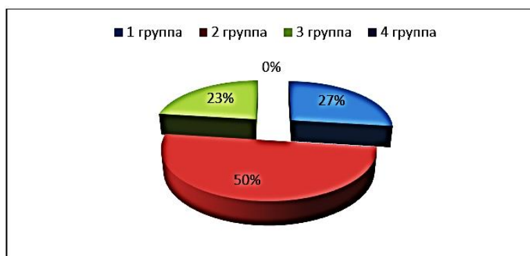
Рис. 1. Мониторинг учащихся 5 «А», 5 «В» классов по методике А.А. Корниенко

По этой же методике мы провели диагностику отношения к трудовому обучению и с учащимися 9 «А» класса.