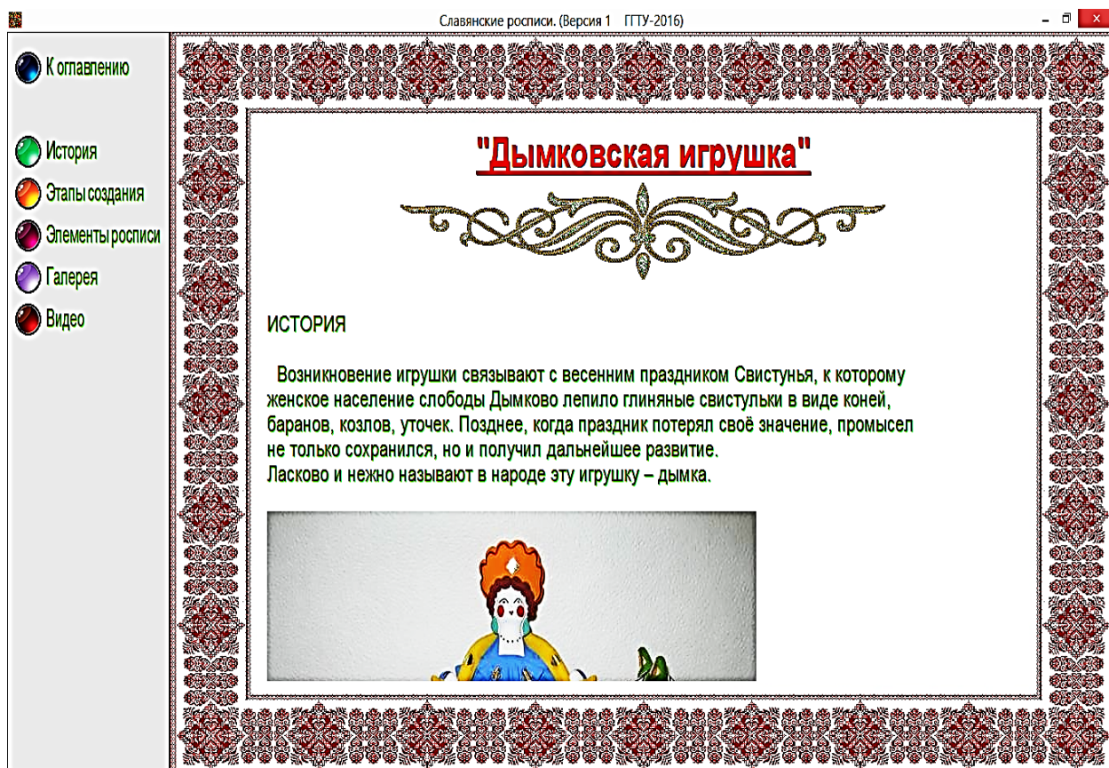
Рис. 2. Пример работы разделов справочника (раздел «Дымковская игрушка»)

Работа над проектом ведётся силами четырёх человек (рис. 3).