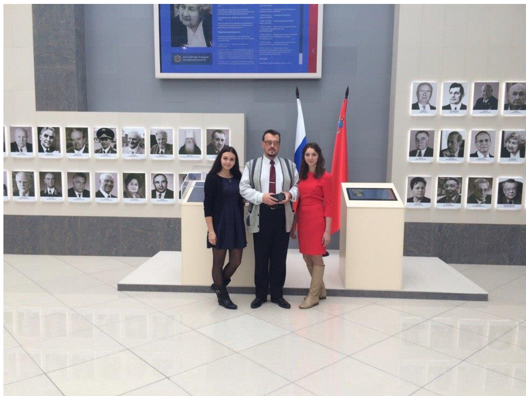
Рис. 7. Выступление в доме правительства Московской области. Фото 2