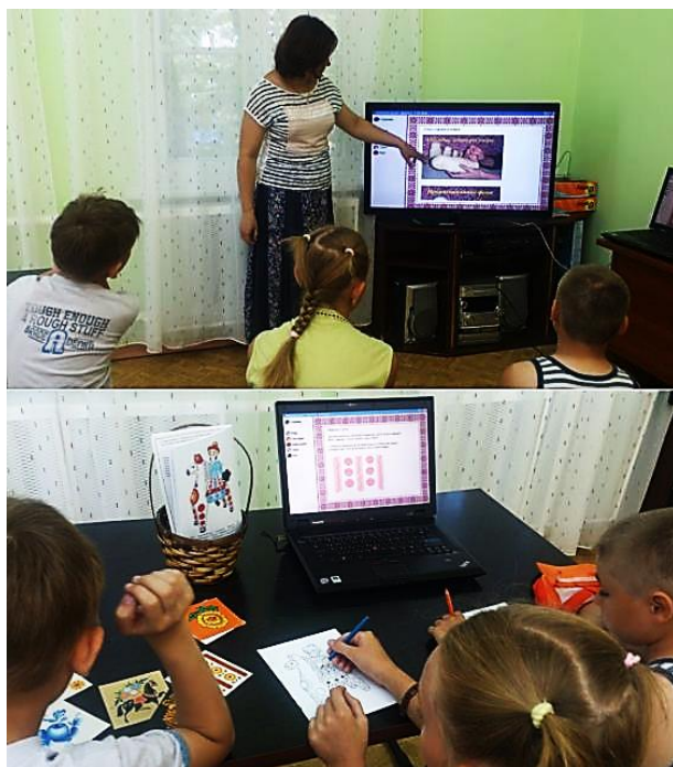
Рис. 5. Предварительная апробация проекта

Последняя версия нашего проекта была представлена на конкурсе Губернатора Московской области: «Наше Подмосковье 2016» По итогам данного конкурса наша разработка получила вторую премию (рис. 6–7).