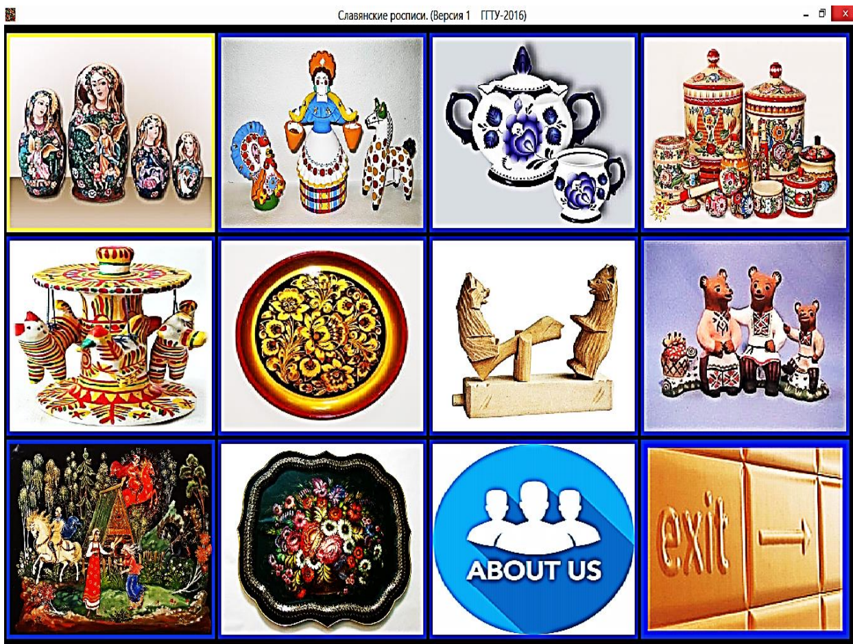
Рис. 1. Визуальное главное меню справочника