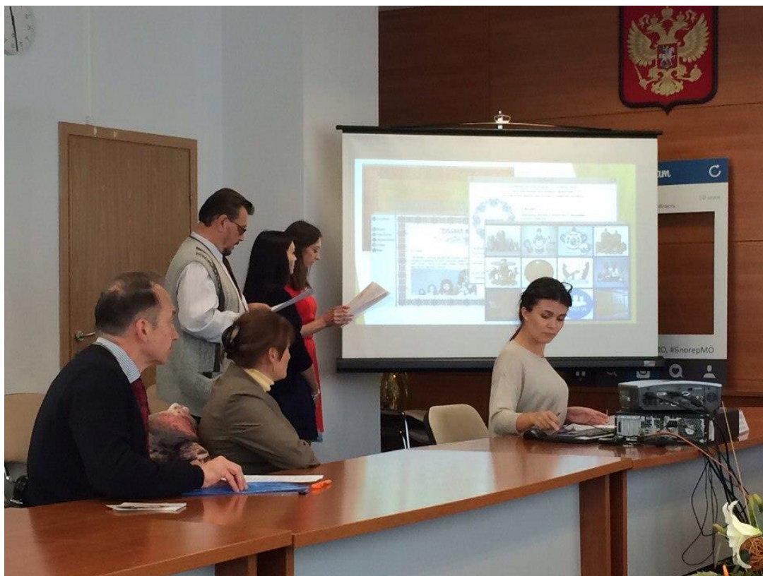
Рис. 6. Выступление в доме правительства Московской области. Фото 1

Последняя версия нашего проекта была представлена на конкурсе Губернатора Московской области: «Наше Подмосковье 2016» По итогам данного конкурса наша разработка получила вторую премию (рис. 6–7).