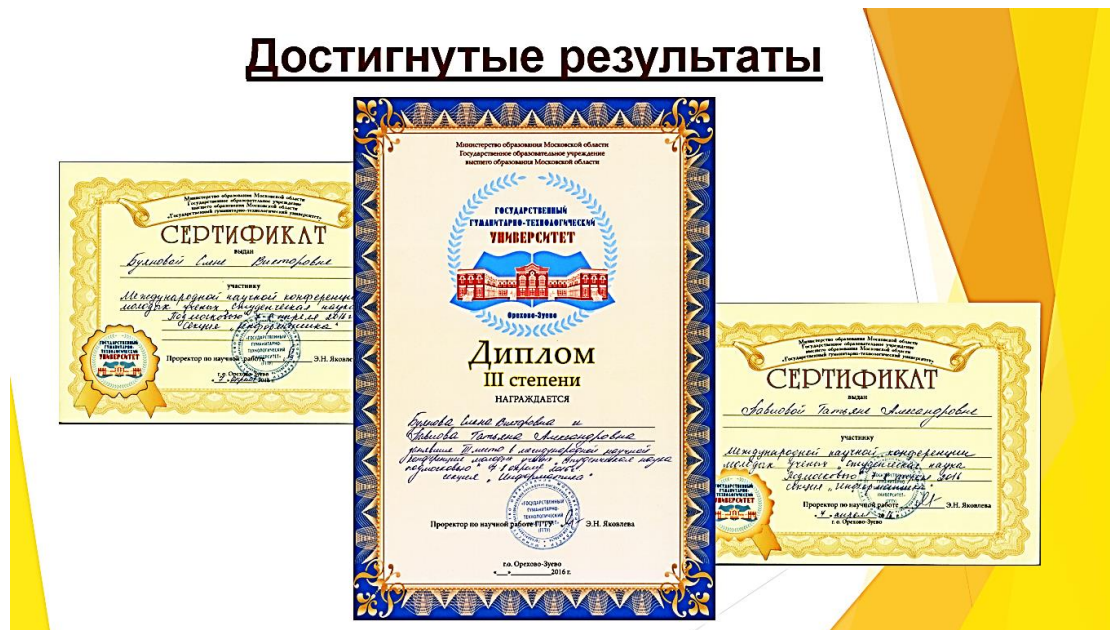
Рис. 4. Достигнутые результаты

Предварительная апробация разрабатываемого нами программного комплекса осуществлялась в Государственном казенном учреждении социального обслуживания московской области «Электростальский социально-реабилитационный центр для несовершеннолетних «Доверие» (рис. 5).