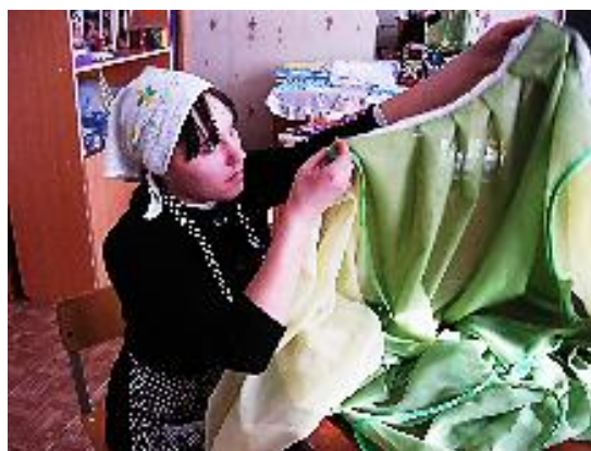
Рис. 3. Пошив изделия. Самоконтроль