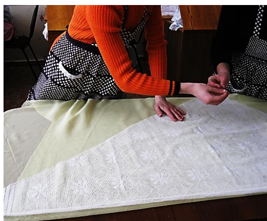
Рис. 2. Разметка материала и раскрой расчёты расходных материалов изделия