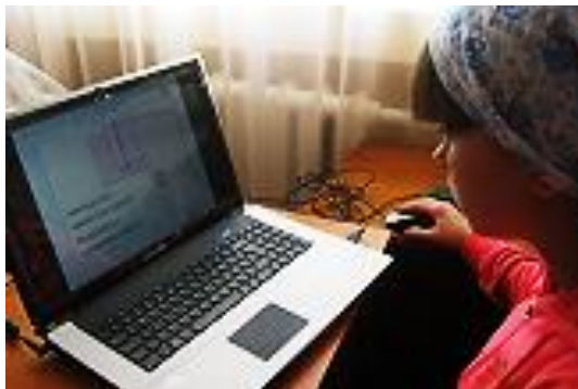
Рис. 5. Тестирование по пройденному материалу. пошива изделия

занятия должны быть насыщены учебной работой. Темп практической части занятия, оптимальный для каждого ученика трудовой группы, должен постепенно возрастать. Чтобы не терять учебное время, необходима предварительная (материальная и организационная) подготовка к занятиям.