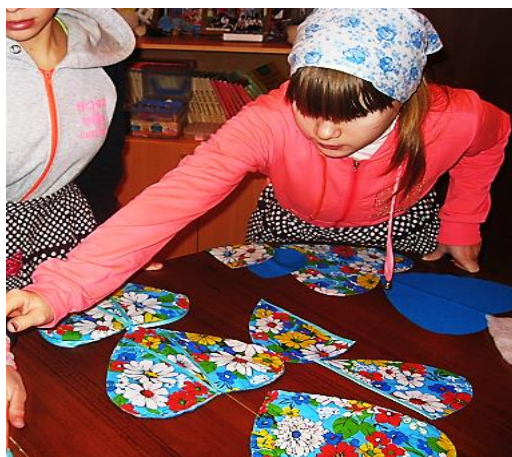
Рис. 6. Составление технологической карты

К концу профессионально-трудового обучения почти все ученики коррекционной школы овладевают в достаточной мере рабочими операционными навыками и в состоянии выполнять довольно сложные комплексные работы (шитье одежды, выполнение творческих работ). Но самое главное учитель никогда не добьется успеха, если не сумеет установить контакт с детьми, основанный на доверии, взаимопонимании и любви.