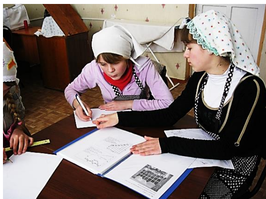
Рис. 1. Обсуждение проекта, выбор модели