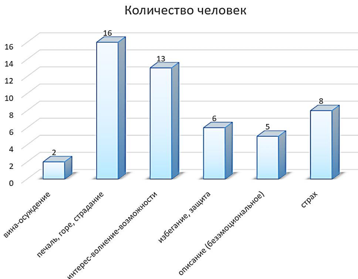
Рис. 1. Результаты опроса об одиночестве, структурированные в соответствующие смысловые блоки

Исходя из полученного в ходе исследования содержания текстового материала, с помощью контент-анализа были выделены следующие смысловые блоки семантики понятия «одиночество»: 1) вина-осуждение; 2) печаль, горе, страдание; 3) интерес-волнение-возможности; 4) избегание, защита; 5) описание (безэмоциональное); 6) страх.