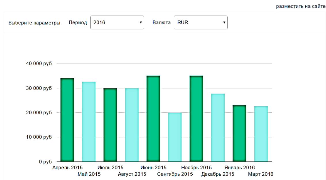
Рис. 3. Динамика заработной платы тренера

На гистограмме изображено изменение уровня средней заработной платы профессии Тренер в России.