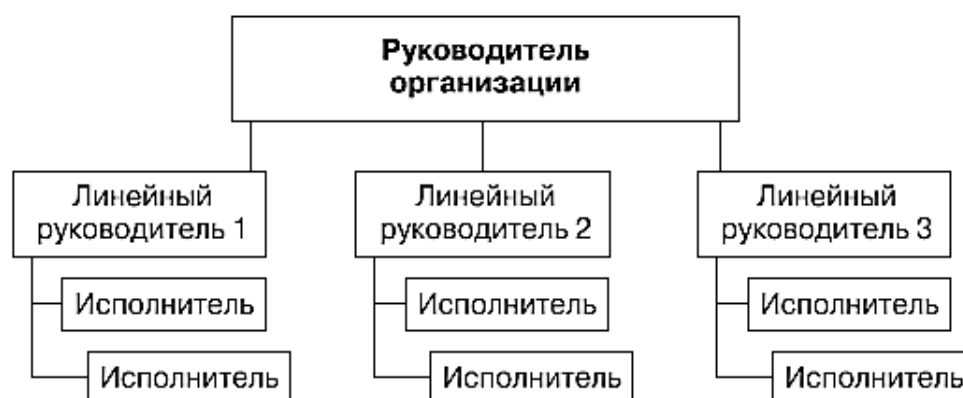
Рис. 1. Линейная структура управления

Рассмотрим виды структур управления, наиболее часто используемые организациями (рис. 1).