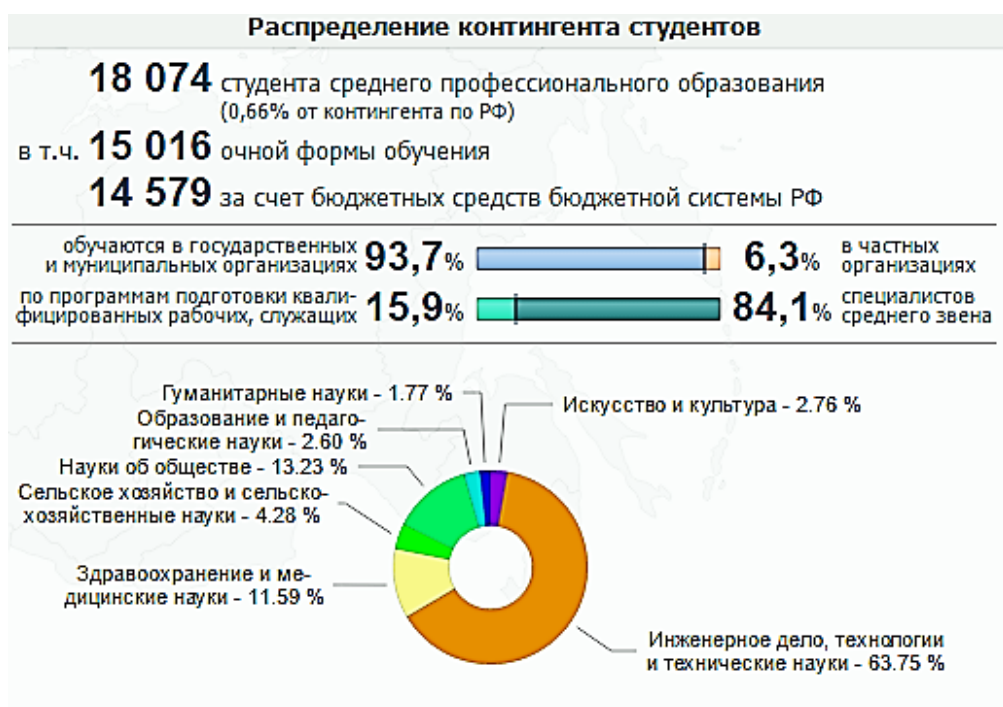
Рис. 2. Контингент среднего профессионального образования Смоленской области

Исходя из представленных данных, в структуре образовательных программ среднего профессионального образования по-прежнему доминирует подготовка по техническим направлениям подготовки, процент которых за пять лет заметно вырос (40% – 2011 г. и 63,75% – 2016 г.) [1, с. 35].