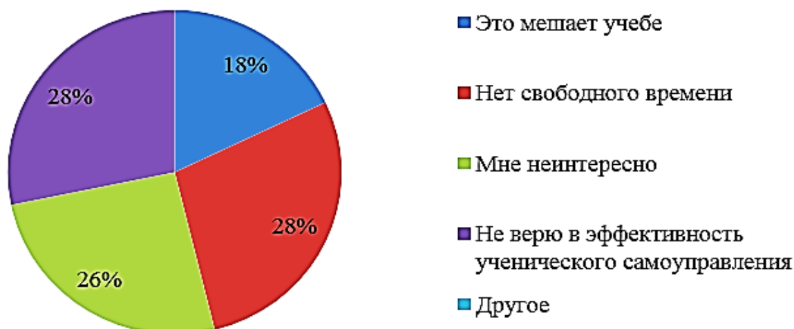
Рис. 2. Диаграмма 2. Распределение ответов на вопрос: «Почему Вы не принимаете участие в ученическом самоуправлении?»

Далее нам важно было узнать, есть ли в школах президенты. Итак, ответы распределились следующим образом: 36% респондентов даже не слышали об этом, 18% ответили, что в их школе президента нет, 22% сказали, что он есть, но лишь фиктивно; и 24% ответили, что президент многое делает для развития самоуправления в школе.