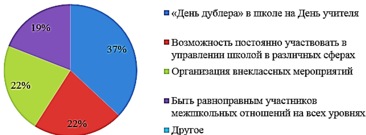
Рис. 1. Диаграмма 1. Распределение вариантов ответа на вопрос: «Что для Вас самоуправление в школе?»

Исходя из результатов, полученных при анализе ответов на данный вопрос, можно сделать вывод, что наибольшее количество опрошенных смотрит на ученическое самоуправление лишь с точки зрения организации одного дня в году. Так, можно сказать, что подростки не понимают всю масштабность самоуправления в школе и не осознают, какие возможности оно дает (Диаграмма 1).