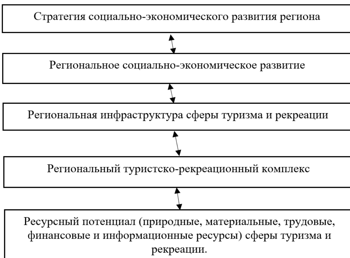
Рис. 2. Схема взаимосвязей ресурсного потенциала сферы туризма с региональным стратегическим социально-экономическим развитием

При решении социальных проблем региона важное значение имеет развитие деятельности в сфере туризма и рекреации, позволяющей создавать новые рабочие места, поддерживать достойный уровень жизни населения и формировать условия для улучшения платежного баланса.