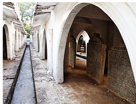
Рис. 3. Расположение плит в пагодах

В 1885 году город Мандалай заняли британские войска, Бирма была присоединена к Британской Индии. Каменная книга осталась без золота и драгоценных камней, ранее её украшавших. Многие пагоды были сломаны... Несмотря на попытки восстановления, достичь прежнего великолепия уже не удалось.