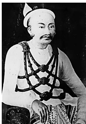
Рис. 1. Король Миндон (1808–1878)

Третья корзина – Абхидха́мма-пита́ка содержит толкование учения Будды. Здесь представлен анализ различных ситуаций, вопросы и ответы, перечни и обзоры предыдущих «корзин», классификация типов людей в зависимости от их состояния и поведения.