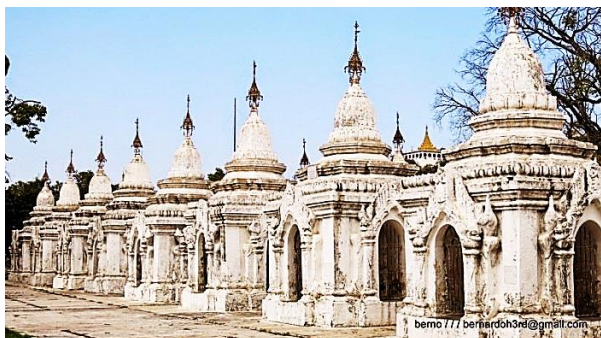
Рис. 2. Ряд пагод с плитами

Пагоды располагались тремя квадратами: внутренний квадрат – 42 мраморных плиты – первая «корзина»; средний квадрат – 168 плит – вторая «корзина»; внешний, самый большой квадрат – 519 плит – третья «корзина».