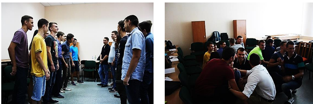
Рис. 1. Фото тренинга для студентов-первокурсников проекта «Прорыв»

В начале тренинга было проведено анкетирование первокурсников с целью изучения мотивов выбора профессии. У 50,0% опрошенных выбор вуза был сделан самостоятельно, по рекомендации – у оставшейся половины; мотив престижа профессии актуален у 52,0% респондентов, возможность найти работу по специальности – 29,0% опрашиваемых, и, наличие профессиональных склонностей только у 14,0% студентов; неопределенная позиция выявлена у 5,0%.