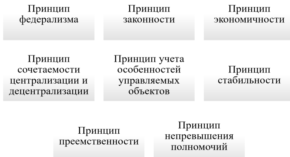
Рис. 3. Некоторые принципы государственного управления

Некоторые более специфические принципы выделены на рисунке 3. Сочетая и применяя эти и другие принципы государственного управления, государственные органы власти отбирают наиболее подходящие механизмы управленческого воздействия.