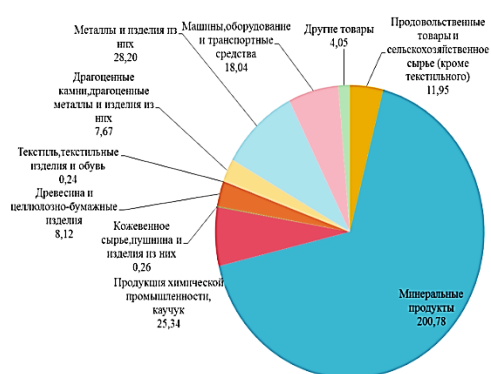
Рис. 1. Товарная структура экспорта России в страны дальнего зарубежья в январе-июне 2015 г. (в млрд долларов)

Проанализируем товарную структуру экспорта России в страны дальнего зарубежья за 2015–2016 гг.