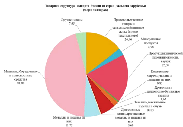
Рис. 4. Товарная структура импорта России из стран дальнего зарубежья в январе-июне 2016 г. (в млрд долларов)