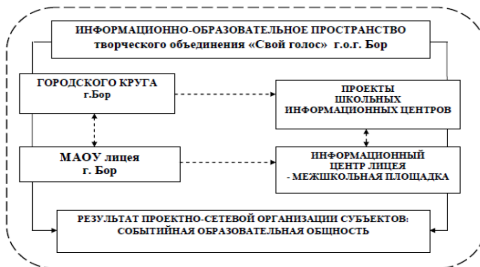
Рис. 1. Модель реализации проектно-сетевой соорганизации субъектов творческого объединения «Свой голос» г. о. г. Бор

и муниципалитетов Нижегородской области. Модель организации межшкольного информационного центра на базе МАОУ лицея г. Бор основана на технологии сетевого взаимодействия субъектов информационно-образовательной среды в рамках системы образования городского округа г. Бор (рисунок 1).