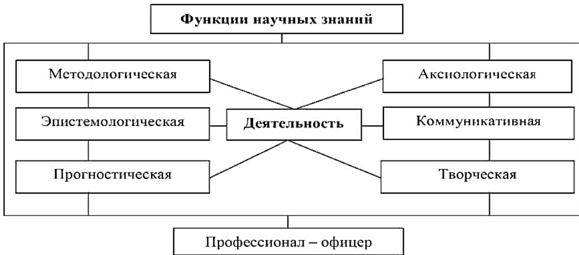
Рис. 1. Функции научных знаний в формировании профессионала – будущего офицера

По нашему мнению, формирование всех основных функций научных знаний и последующее их применение, невозможно без целостного понимания и осознания человеком его предстоящей профессиональной деятельности, которая формируется на базе и в процессе «живого» общения родителя и ребенка, учителя и ученика, мастера и подмастерья, которого не заменит (если только дополнит) ни одна даже самая передовая тестовая задача или программа. В этой связи встает необходимость восстановления системы народного и военного образования в ценностно-ориентированном ключе, предстоящей деятельности, для того чтобы будущая профессия приносила не только персональную прибыль, но и была социально-ориентированной, а ее добросовестное выполнение вело, в конечном итоге к процветанию народа и всей страны в целом.