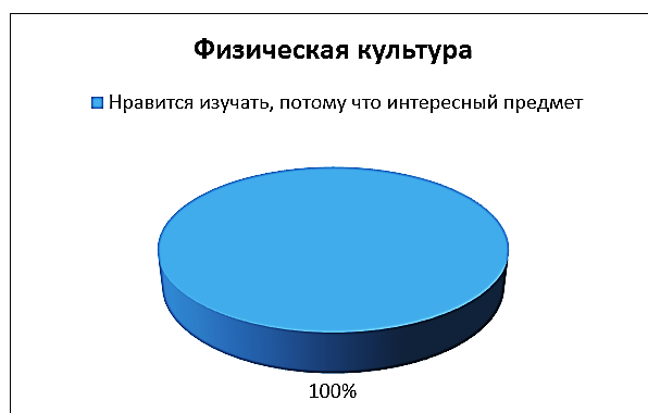
Рис. 2. Интересный предмет

Для сравнения в 2015 году в ноябре было проведено анкетирование 4 курса ФК, поступивших в 2011 году, по той же методике, результаты показали, что приоритетной дисциплиной в изучении у студентов является физическая культура (рис. 2).