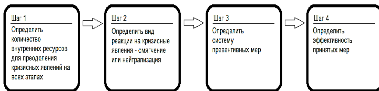
Рис. 2. Схема подготовки к опережающему реагированию на кризисные явления

прогноза на основе этих слабых сигналов – устранить возникающие проблемы до того, как они примут необратимый характер (рис. 2).