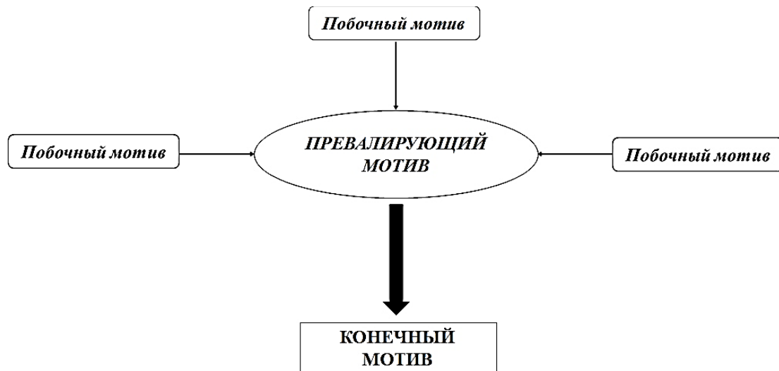
Рис. 2. Способ формирования конечного мотива серийного убийства

Исходя из всего вышесказанного, можно сделать вывод о том, что тема мотивации серийных убийц является дискуссионной и нуждается в дальнейших исследованиях.