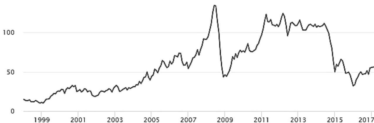
Рис. 1. Динамика цен на нефть Brent, долларов за баррель

Использование средств Резервного фонда позволяет сглаживать волатильность государственных доходов, обеспечивая выполнение расходной части бюджета вне зависимости от текущей конъюнктуры сырьевых рынков. Истощение фонда ограничит бюджет в этой возможности. На рис. 1 представлена динамика цен на нефть за период 1999 – февр. 2017 гг. На рис. 2 представлена динамика валютного курса рубля к доллару за 1999 – февр. 2017 гг.