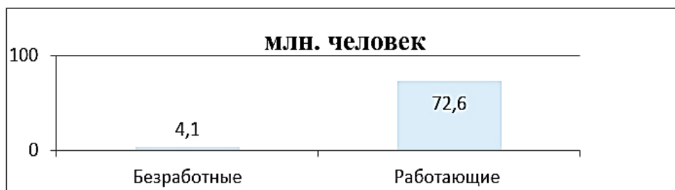
Рис. 1. Уровень безработицы на конец 2016 года по данным Росстата