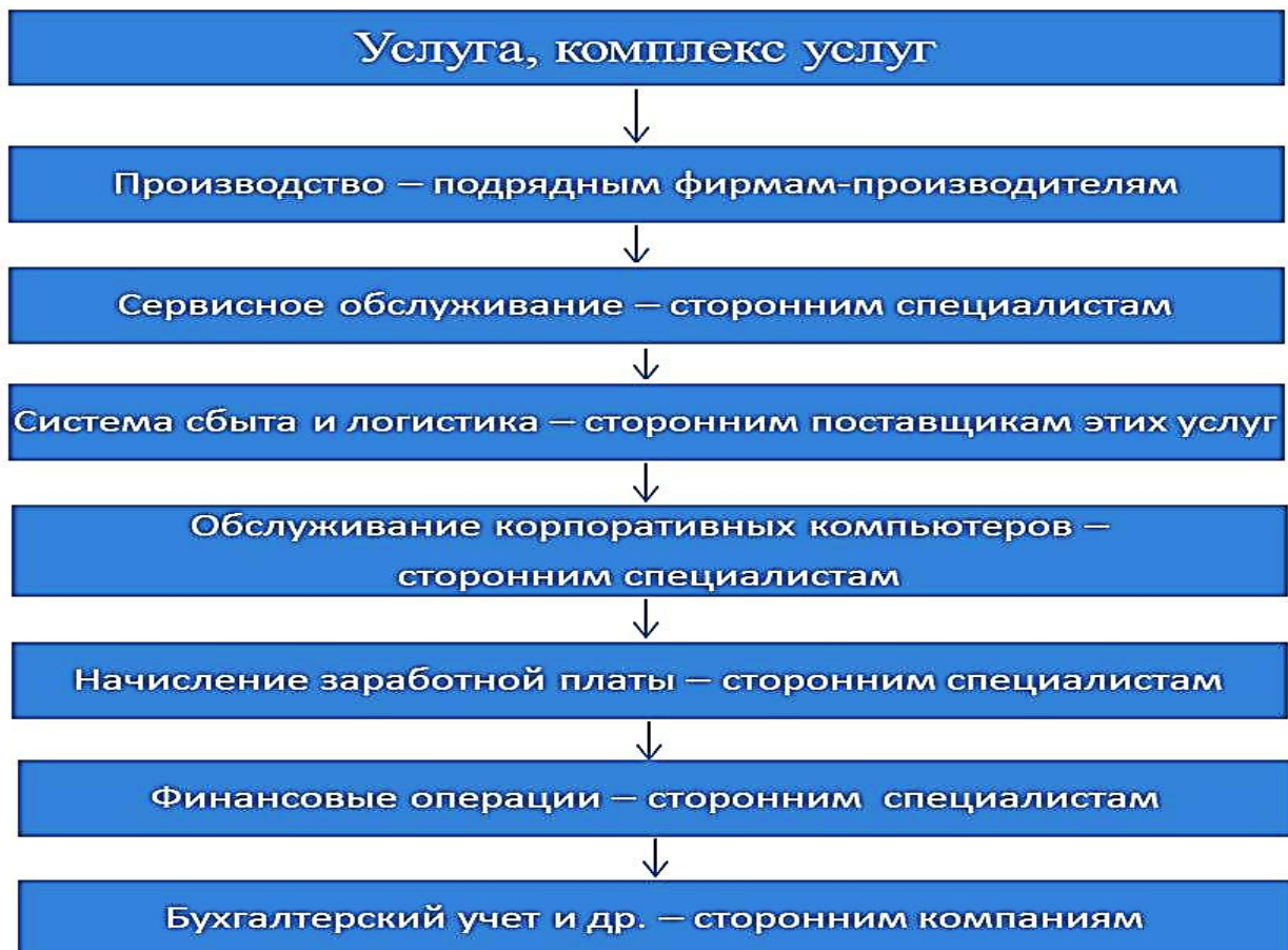
Рис. 3. Основные процессы, передаваемые на аутсорсинг

Со временем многое изменилось. Сегодня аутсорсинг активно используется как крупными, так и небольшими предприятиями. На аутсорсинг передают многие услуги, комплексы услуг (рис. 3).