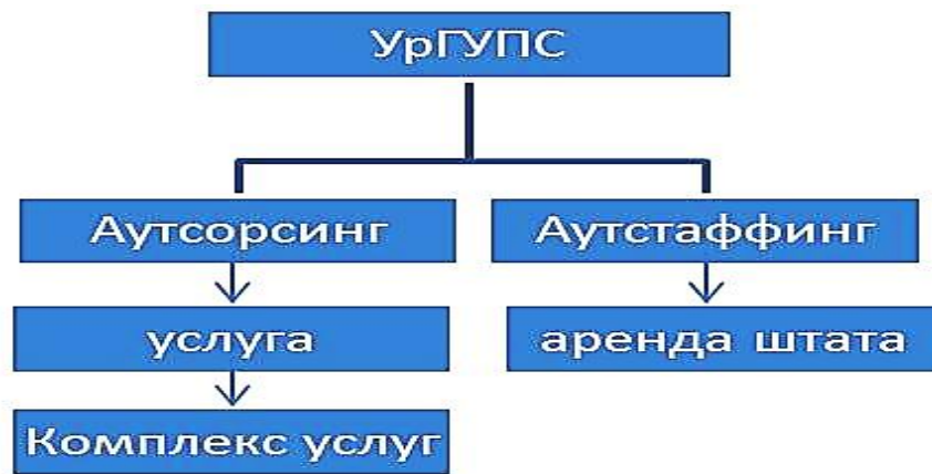
Рис. 2. Схема выбора варианта передачи на аутсорсинг или аутстаффинг

Со временем многое изменилось. Сегодня аутсорсинг активно используется как крупными, так и небольшими предприятиями. На аутсорсинг передают многие услуги, комплексы услуг (рис. 3).